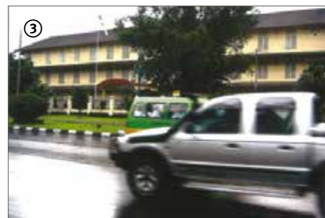
③ Buitenzorg, 14e Bataljon. (foto 2007)