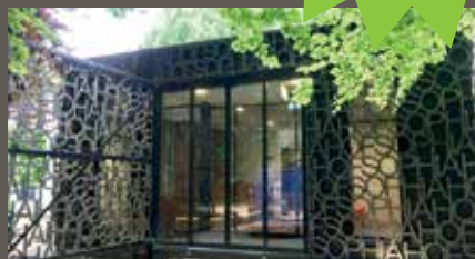
De nieuwe entree van Nationaal Museum Sophiahof - van Indië tot nu.

En om nog wat langer in de sfeer van de evenementen te blijven, kijken we hier ook nog even terug op onze deelname aan de succesvolle 61ste Tong Tong Fair die van 23 mei tot en met 2 juni traditiegetrouw op het Malieveld in Den Haag plaatsvond. Ruim 80.000 mensen bezochten de fair deze keer en wat daarbij vooral opviel was het percentage jongeren dat de grootste Indische manifestatie dit jaar bezocht.