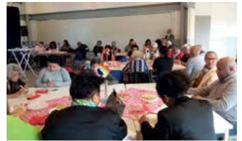
Bingo in Nunu Mahua.