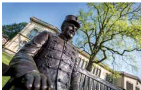
Landgoed Bronbeek