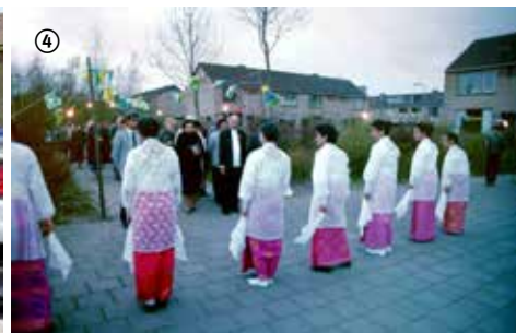
③ Bezoek minister Rita Verdonk in 2006.

Na zijn presentatie is het tijd voor de lunch. Achter in de zaal kunnen bewoners en belangstellenden zich al intekenen op het gedenkboek. Van het gedenkboek Panggajo Van woonoord naar woonwijk worden maar 400 exemplaren verkocht en de Molukse gemeenschap Capelle krijgt als eerste de gelegenheid om in te tekenen. Pas vanaf eind mei konden ook anderen zich intekenen. Een paar dagen na mijn bezoek krijg ik van Roy een e-mail. Op 25