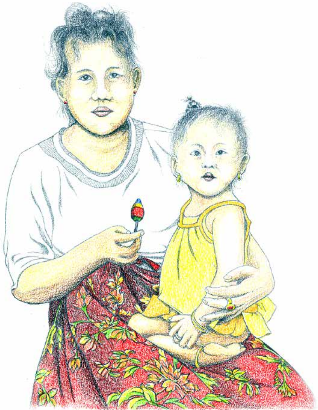
Buginese moeder met kind en een ijslollie voor allebei In de haven van Surabaya.

(Potlood, kleurpotlood op papier, 29,7x42 cm. 2000) Cary Venselaar