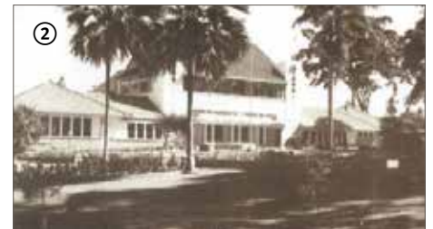
① Soekaboemi, Prinses Julianaschool.