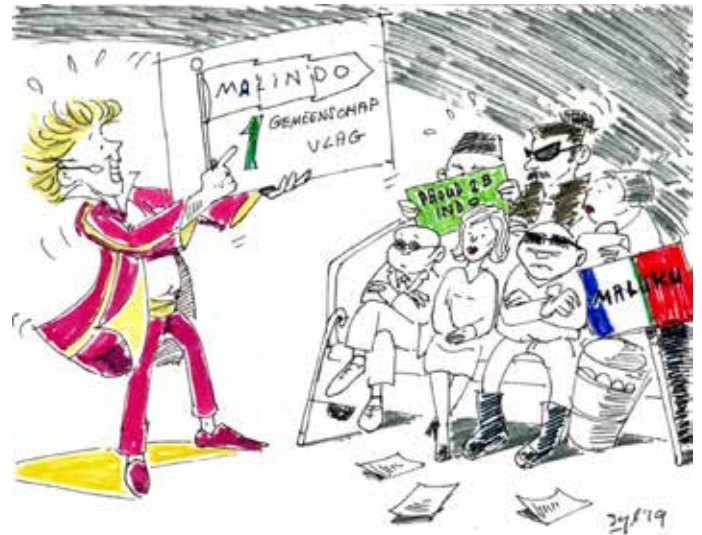
@Sylvia Hiert-Artifart 2019

In de pasanggrahan te Selat is het mij gebeurd dat, toen een jong getrouwd paar, Franschen, op weg naar Karangasem het middagmaal gebruikten, een inlander een buitengewoon mooien grooten rijkversierden schotel, van wel een halve meter middellijn, een heel oud stuk, kwam aanbieden. Chineesch porselein heb ik nooit verzameld, dat is mij te kostbaar en er zijn al zoo veel liefhebbers die dat verzamelen, doch deze schitterende schaal wekte de begeerte in mij om haar te bezitten. De Franschman scheen nauwelijks acht op dit fraaie stuk te slaan, en ik dacht, zoodra hij weg is, ga ik toch eens onderhandelen. Toen de maaltijd was afgelopen stapte het jonge paar in hun auto; hij wenkte de Baliër, nam de schotel en gaf er vier rijksdaalders voor in ruil. Weg reed de auto en weg was de kostbare schotel!