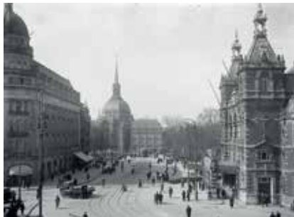
Amsterdam Leidseplein (ca. 1920), zicht op Koepelkerk en rechts Duwaer & Naessens gebouw. (collectie SERC)

komende vanuit Nederlands-Indië weer in Nederland gevestigd had in Baarn op de oude algemene begraafplaats aan de Berkenweg begraven. Hij bereikte de leeftijd van 52 jaar. Waarom de begrafenis in Baarn plaats vond is niet te achterhalen; het echtpaar woonde immers in Soes dijk, gemeente Soest. Ook hun kinderen woonden niet in de directe omgeving. Mogelijk ging het echtpaar in Baarn naar de kerk en vond daarom de begrafenis in Baarn plaats. We weten het niet.