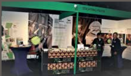
Tong Tong Fair.

En om nog wat langer in de sfeer van de evenementen te blijven, kijken we hier ook nog even terug op onze deelname aan de succesvolle 61ste Tong Tong Fair die van 23 mei tot en met 2 juni traditiegetrouw op het Malieveld in Den Haag plaatsvond. Ruim 80.000 mensen bezochten de fair deze keer en wat daarbij vooral opviel was het percentage jongeren dat de grootste Indische manifestatie dit jaar bezocht.