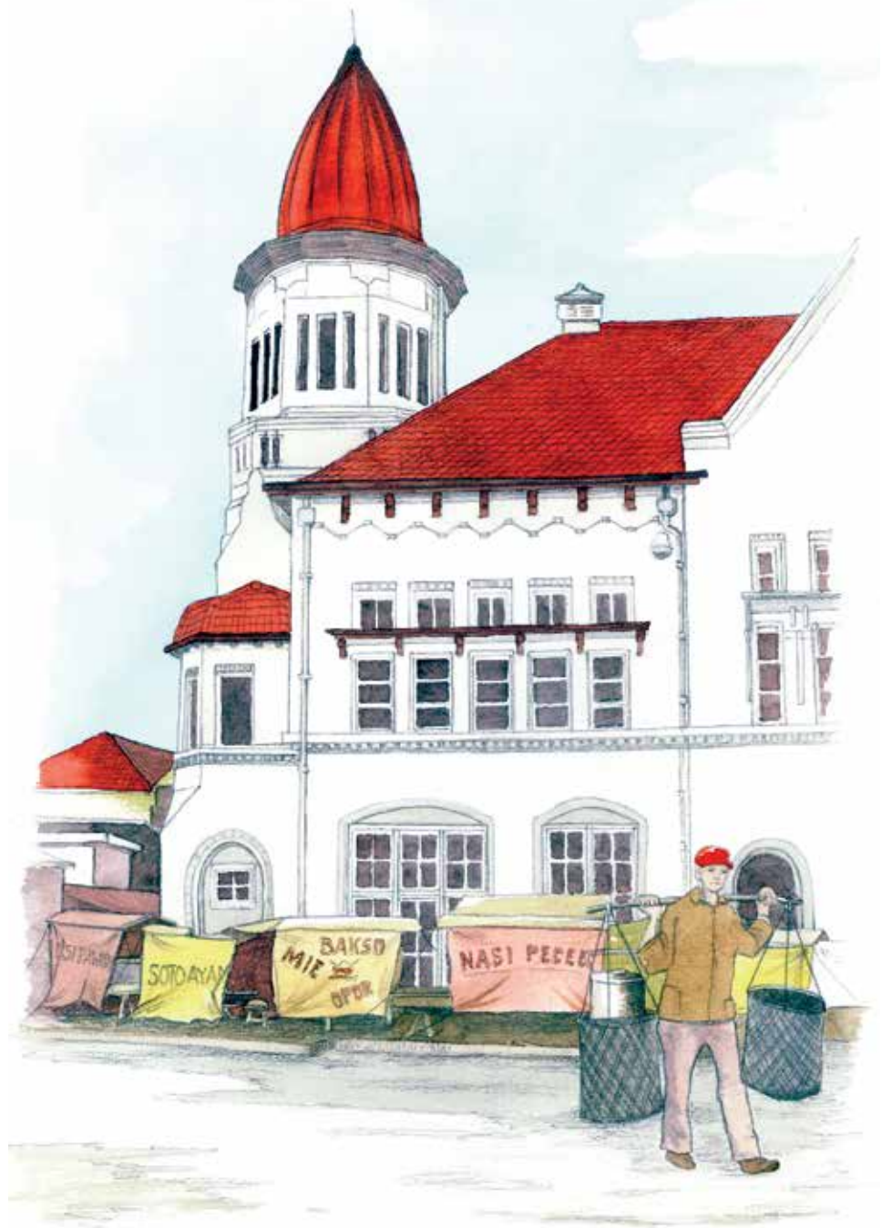
Een hotel in het oude centrum van Surabaya Het Ibis Hotel gaat schuil achter kramen. (Potlood, penseel en gekleurde inkt op papier, 21x29,7 cm. 1998) Cary Venselaar