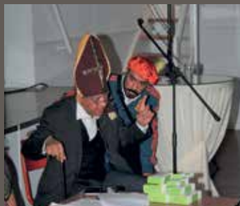
Delta Dua in topvorm op Djalan Pienterdag.

Afsluitend maken we hier nog melding van de heel succesvolle 'Djalan Pienter' inspiratiedag die Pelita samen met woonzorgcentrum Raffy en de Landelijke Stichting Molukse Ouderen (LSMO) op 2 april in het Migratiemuseum in Den Haag organiseerde. Djalan Pienter is ons scholingsprogramma voor professionals en vrijwilligers in de zorg die in hun werk contact hebben met Indische en Molukse ouderen. Dit opleidingsprogramma beoogt hen vertrouwd te maken met de cultuurspecifieke zorg voor deze ouderen. De opzet is de zorgverlening te verbeteren. Meer informatie kunt u vinden op www.djalanpienter.nl